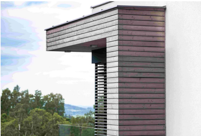
1534 – 1 Vergrauung.jpg

Um dem bestehenden Trend zur Vorvergrauung von Holz im Außenbereich zu entsprechen hat Remmers Aqua OVL-49/tm-Öl-Vergrauungs-Lasur [eco] entwickelt.