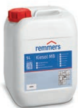
Kiesol MB (Termékszám: 300805)

Vigyen fel Color PA homlokzatfestéket a lábazati vakolatra és a vakolat vízszigetelésére!