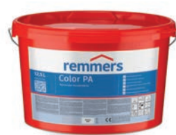
Color PA (Termékszám: 650013)

Az MB 2K vízszigetelő termékkel végzett lábazati munkálatokhoz bővebb információért és további tervezési példákért – így részletes rajzokért – tekintse meg lábazatokról szóló útmutatónkat.