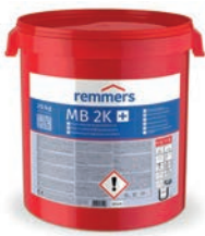
MB 2K (Termékszám: 301425)