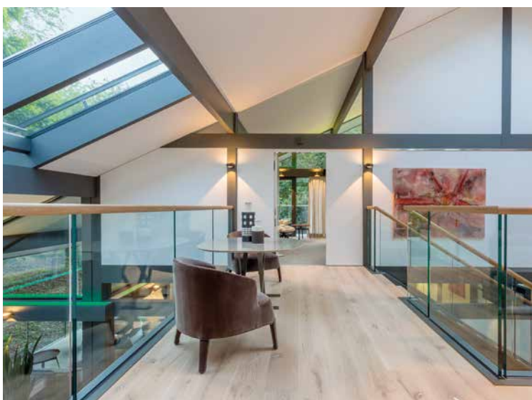
Die Innenarchitektur verbindet helle und moderne Elemente mit einer charakteristischen dunkelgrauen Fachwerkkonstruktion.

verwendet, so dass der exklusive Wohnkomfort sich auch im Raumklima niederschlägt. Das Unternehmen HUF HAUS setzt beim Bau der Häuser nicht nur auf innovative Energietechnik, modernes Design und langhaltigen Holzschutz – die eingesetzten Materialien sind qualitätsgeprüft und nicht aus Tropenholz gefertigt.