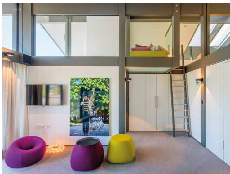
Von Pink bis Violett findet sich in der Einrichtung das komplette Farbspektrum wider.