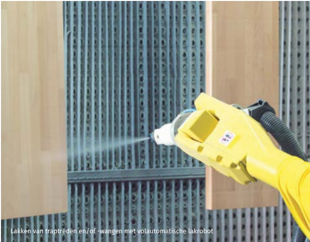
Lakken van trapreden en/of -wangen met volautomatische lakrobot