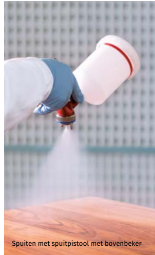
Spuiten met spuitpistool met bovenbeker