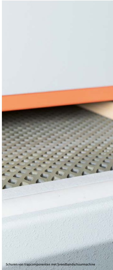
Schuren van trapcomponenten met breedbandschuurmachine