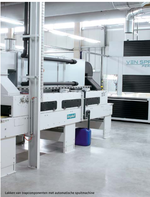
Lakken van trapcomponenten met automatische spuitmachine