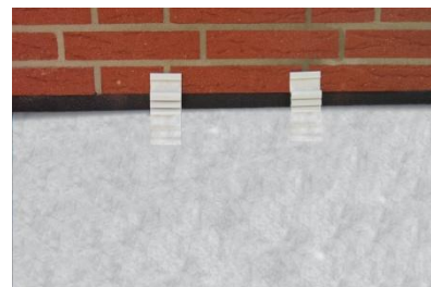
Abb. 3 Schutzbahn hinter DS Protect Clips [basic] ziehen. Vlies vor den DS Protect Clips [basic] positionieren.