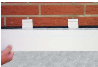
Abb. 4 Anbringen der DS Protect AL. Leiste einfach in DS Protect Clips [basic] einrasten lassen.