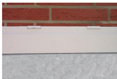
Abb. 5 Komplettansicht mit DS Protect AL.